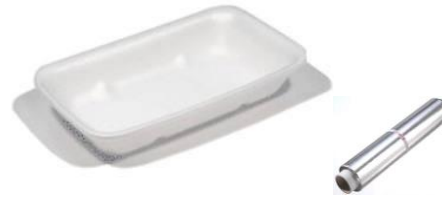
Un vassoio largo e lungo e un po' di carta d'alluminio o...