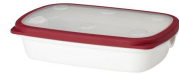
...un contenitore per cibi largo e lungo