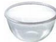
Una ciotola grande