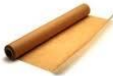
Un po' di carta da forno e da cucina