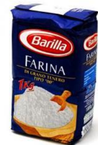
Due uova o più e mezzo chilo di farina